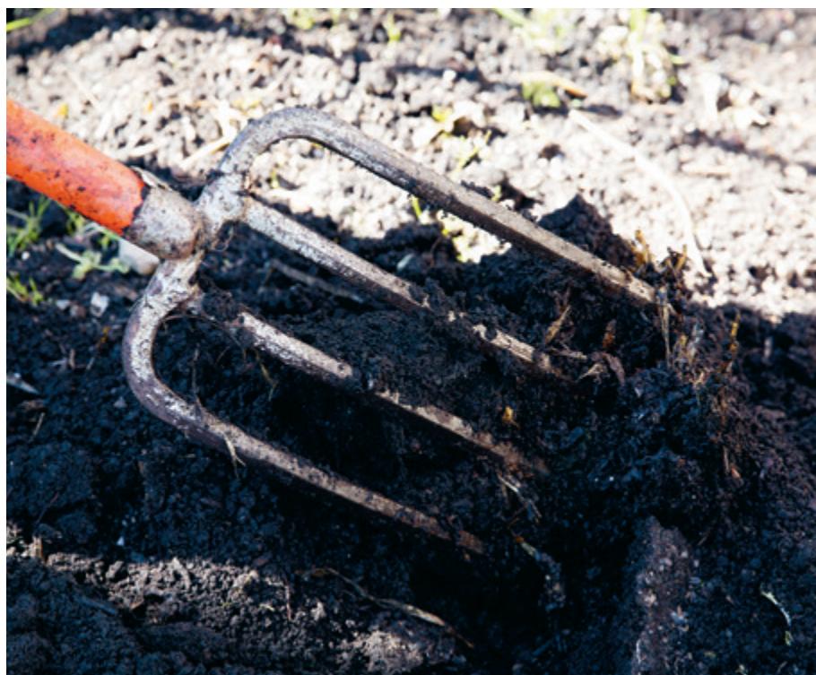
Le biochar augmente l'agrégation des particules du sol, donnant des terres meubles et grumeleuses.

Les écosystèmes naturels animés par ces systèmes de communication sont la base des sols sains, car ils amplifient leur biodiversité. Plus les formes de vie sont nombreuses, plus les ressources alimentaires sont exploitées, et plus le tissu vivant est robuste. La structure cellulaire carbonisée du biochar, constituée de compartiments et de poches, fait office d'immeuble logeant toute une variété de micro-organismes. Ils y trouvent un abri les protégeant de leurs prédateurs, ainsi que des espaces pour y déverser les produits de leur métabolisme, des substances qui isolent les minéraux et participent à la qualité de la structure du sol.